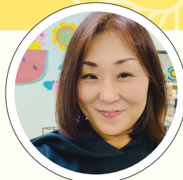
● 花のフナハン 取締役

岐阜県高山市で「プチホテル&レストランホワイトルンゼ」を営む。両親から事業を引き継いだ後、プライダル事業の立ち上げやアレルゲンフリーのスイーツ開発など、新たな取り組みを展開している。