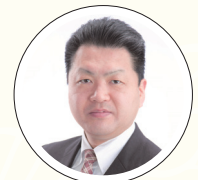
中小企業基盤整備機構 中部本部 中小企業アドバイザー